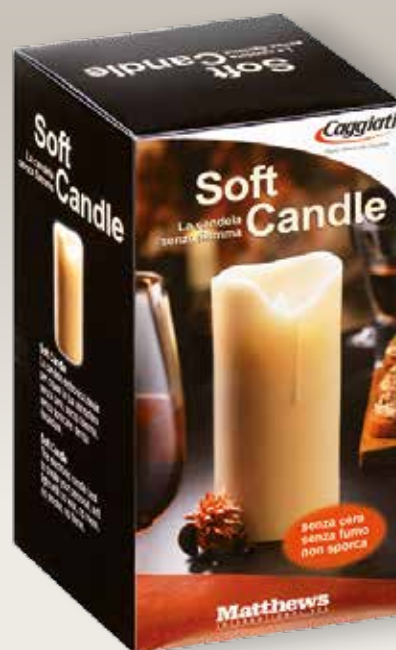
95 038/0 Mini cm ±9 ø4,2