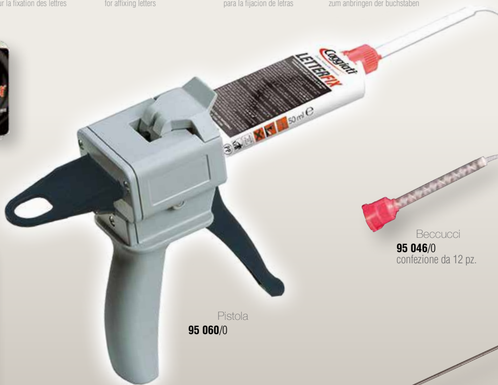
Pistola 95 060/0