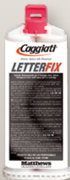
Cartucce 95 044/0 confezione da 6 pz.