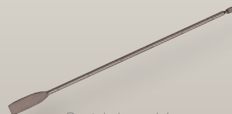
Spatola in acciaio 95 043/0