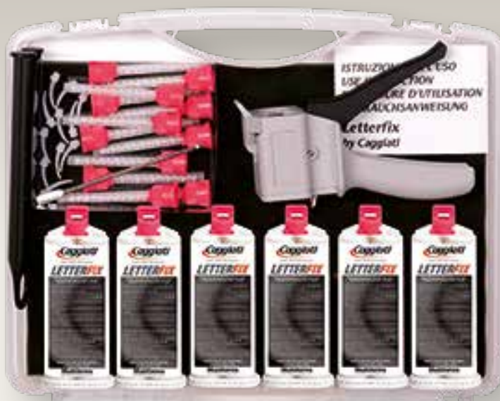
Kit completo 95 056/0 valigetta, pistola, 6 cartucce, 12 beccucci, spatola in acciaio cm +25x26x14