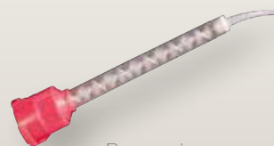
Beccucci 95 046/0 confezione da 12 pz.