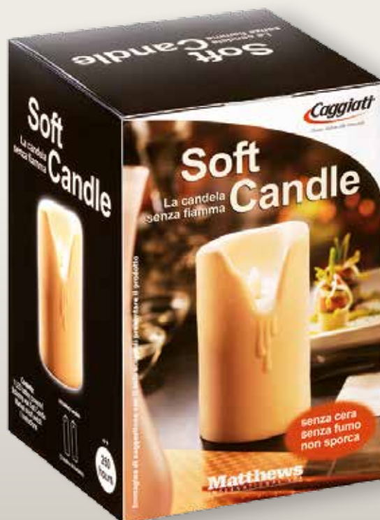
95 049/0 Piccola cm ±11,5 ø5,3