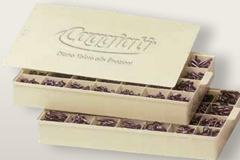
95 121 - Casellario in Abs per caratteri con 28 scomparti completo di coperchio

Für eine geordnete aufstellung der schriftzeichen