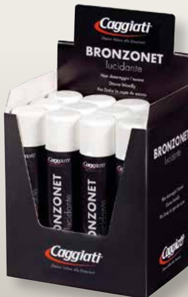
95 068/12 Box 12 Confezioni Bronzonet