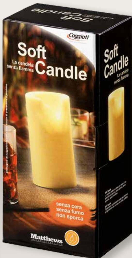
95 024/0 Grande cm : 16,5 ø8,5