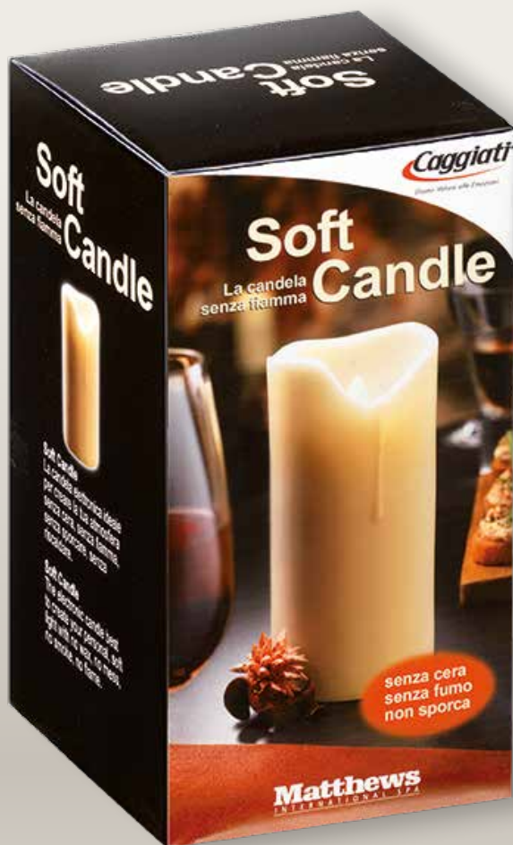
95 036/0 Media cm ±12,5 ø7,5