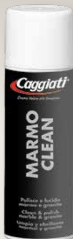
95 080 Marmo Clean contenuto 400 ml

Um den marmor und granit zu reinigen und glänzend zu machen.