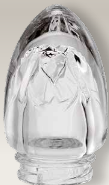
Boccioli di Rosa 98 039/0 cm ±10x6,5xø5