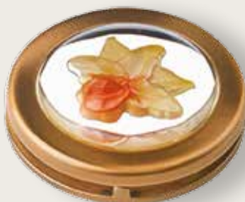
Portina cristallo - orchidea gialla