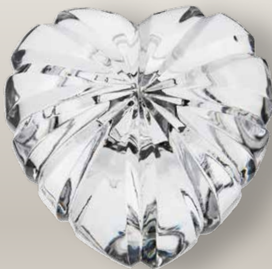
98 019/0 cm ±8x8,±5