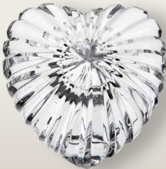
98 025/0 cm 18x8,2x5