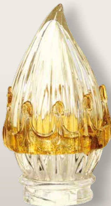
98 145/0 cm ±12x7xø5