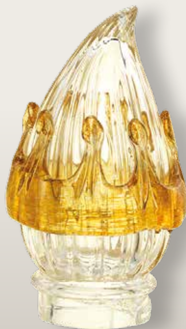
98 128/0 cm ±12x9,5xø6