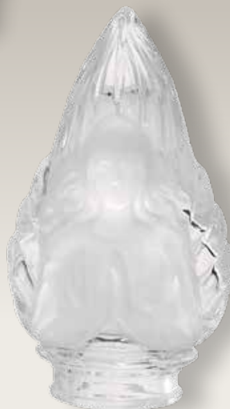
98 141/0 cm ±12x7 ↻ø5