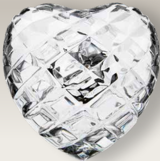
98 021/0 cm ±8x8,±5