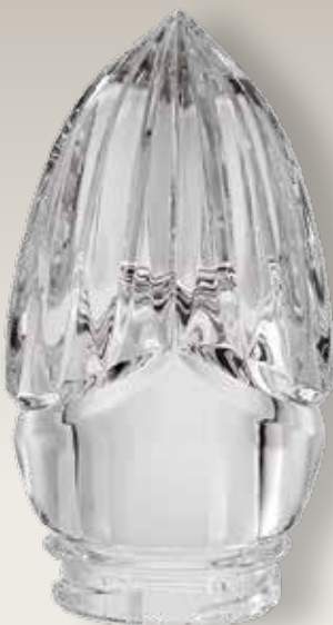
98 111/0 cm ±11x7 ↻ø5