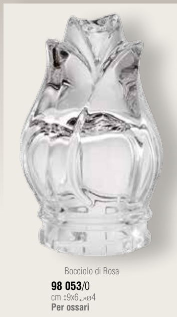
Bocciolo di Rosa