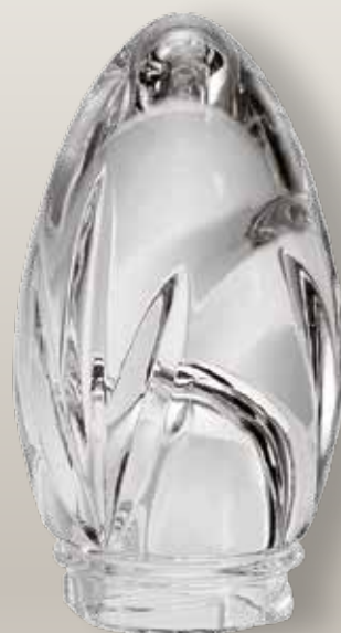
98 113/0 cm ±11x7 ↻ø5