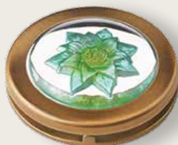
Portina cristallo - margherita verde