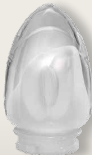
Calla interno satinato