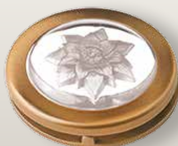
Portina cristallo - margherita neutra