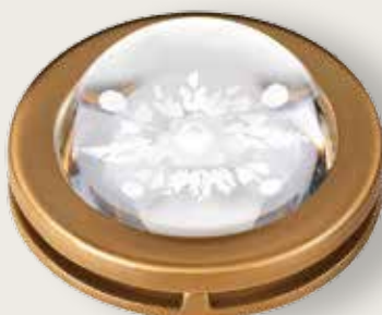
Portina cristallo - Fiore grande