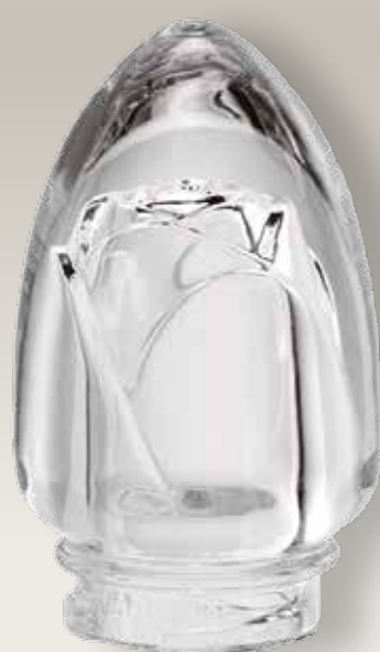
Rosa 98 026/0 cm ±10x6,5xø5