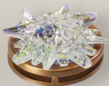
Portina cristallo - Cristallo con iridescenza