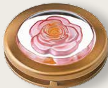
Portina cristallo - rosa colorata