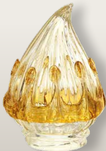
98 150/0 cm ±9x5,5xø3,5 Per ossari