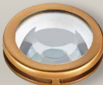
Portina vetro molato