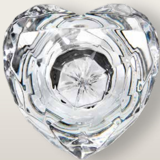
98 032/0 cm ±8x8,±5