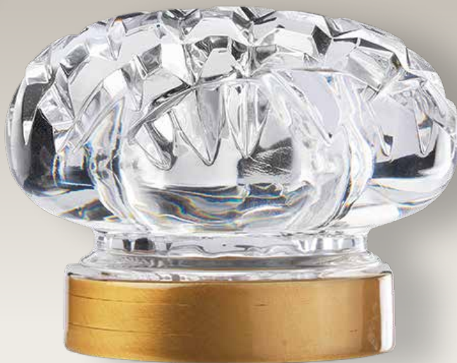
9 962/0 cm 16x6 ghiera senza fiamma