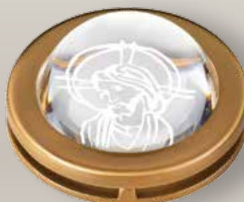
Portina cristallo - Cristo