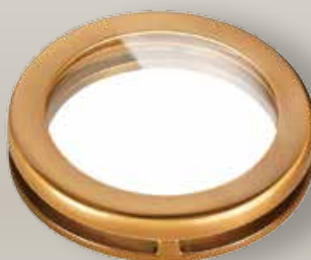
Portina vetro pirex