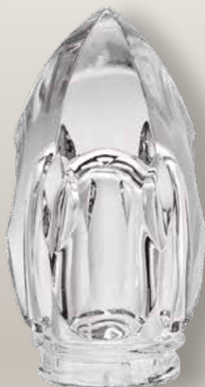
98 115/0 cm ±11x7 ↻ø5