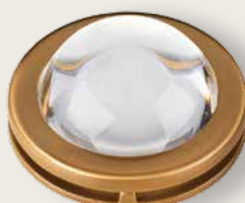
Portina cristallo - Neutro