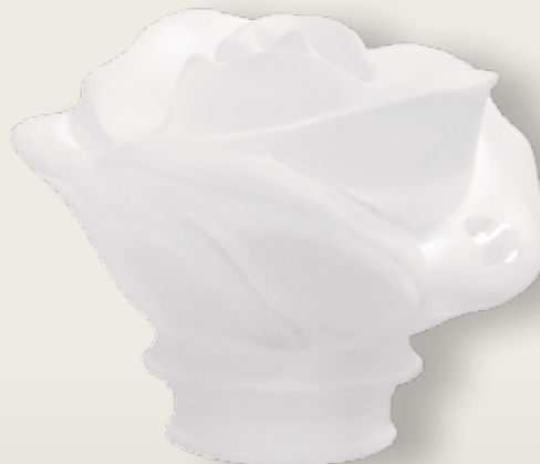
Rosa del Cuore satinata con cuore lucido