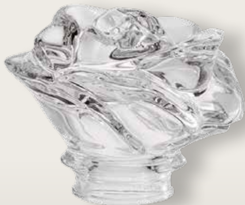
Rosa del Cuore con cuore satinato