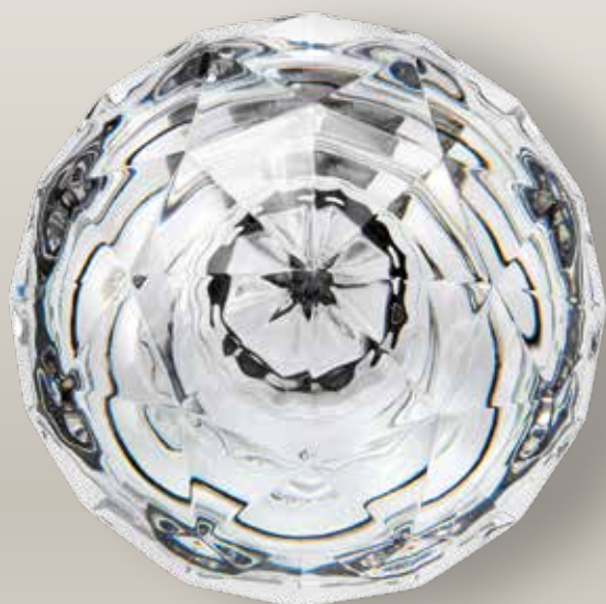
98 038/0 cm 10,8x8,2x5