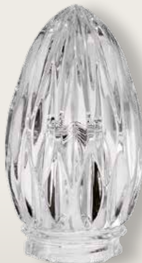
98 109/0 cm ±11x7 ↻ø5