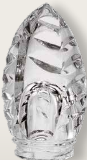
98 107/0 cm ±11x7 ↻ø5