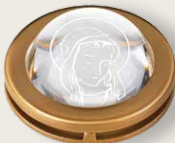
Portina cristallo - Madonna