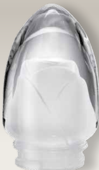
Rosa interno satinato 98 024/0 cm ±10x6,5xø5