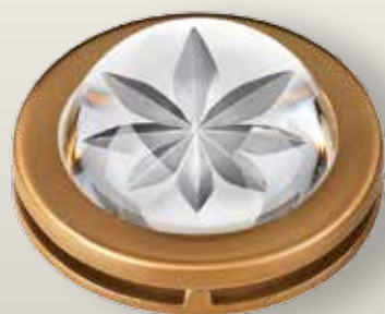
Portina cristallo - Stella