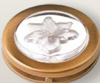
Portina cristallo - orchidea neutra