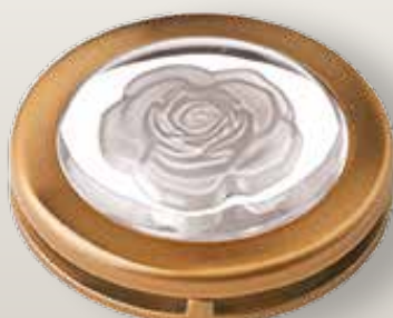
Portina cristallo - rosa neutra