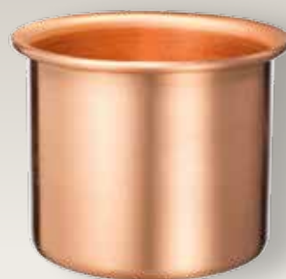
A RICHIESTA PORTACERO